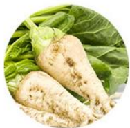
Barbabietole da zucchero