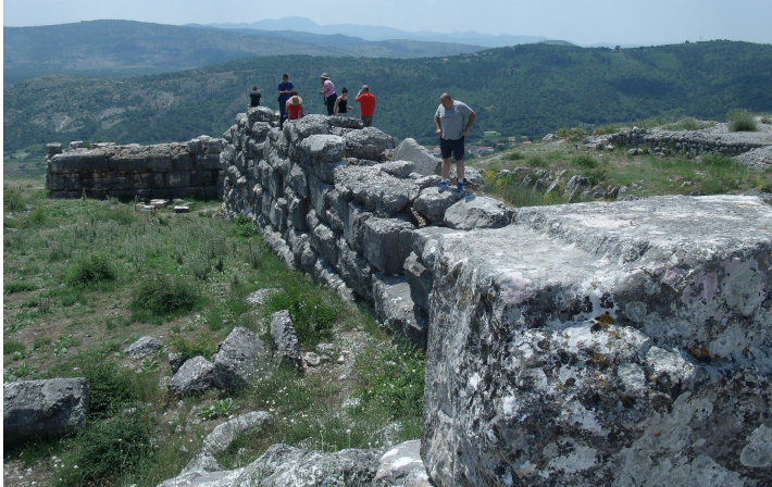
"I Care for Počitelj-Stolac" -edizione 2014- Visita alle rovine dell'antica città di Daorson