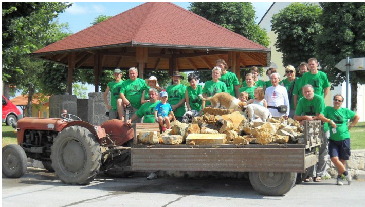
"I Care for Drežnik Grad" -edizione 2012- Fotoricordo dopo pulizia del pozzo medievale

Club UNESCO di Udine Membro della Federazione Italiana del Club e Centri UNESCO Associata alla Federazione Mondiale