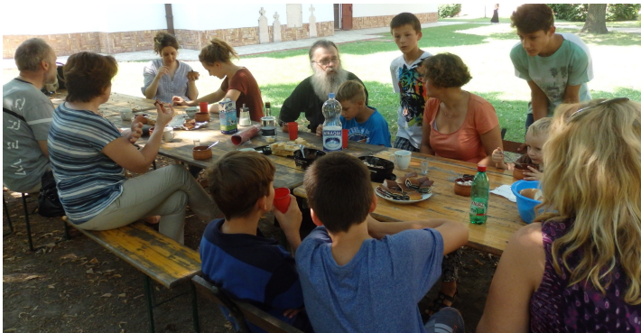
"I Care for Bač" -edizione 2015- Merenda nel monastero ortodosso di Bođani

Quest'estate vuoi vivere una vacanza con un'ottica diversa? Spendendo poco e arricchendoti di nuove conoscenze e amicizie? Scoprendo nuovi sapori, bellezze naturali e beni culturali Patrimonio UNESCO ?